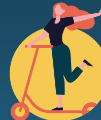
MOBILITÀ DEL FUTURO