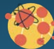
ESTRAZIONE DI URANIO