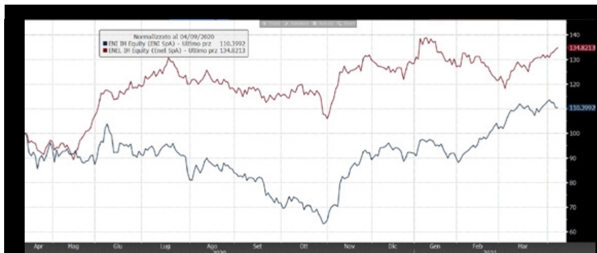
ENI ED ENEL AD UN ANNO

sottostanti viaggiano a ridosso dei loro strike iniziali. Si tratta di un classico certificato a premi periodici trimestrali del 2% con effetto memoria. Il trigger per i premi è al 60% dello strike iniziale, quindi si tratta di una struttura in grado di pagare premi periodici anche in presenza di forti ribassi delle quotazioni dei titoli sottostanti, purché non superiori al -40%. In tal caso scatta però l'effetto memoria che accantona i premi eventualmente non distribuiti. La peculiarità risiede invece nell'opzione autocallabile.